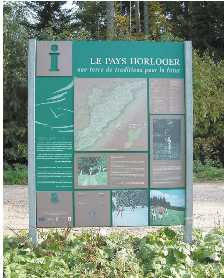
Le Pays : un découpage administratif issu de la loi Pasqua-Voynet.