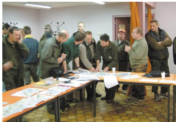
Préparation d'une battue.

- développé un mode de régulation du sanglier en milieu péri-urbain en faisant intervenir des chasseurs à l'arc à proximité des habitations et des chasseurs « classiques » en périphérie (cf battue réalisée en 2003 sur Besançon),