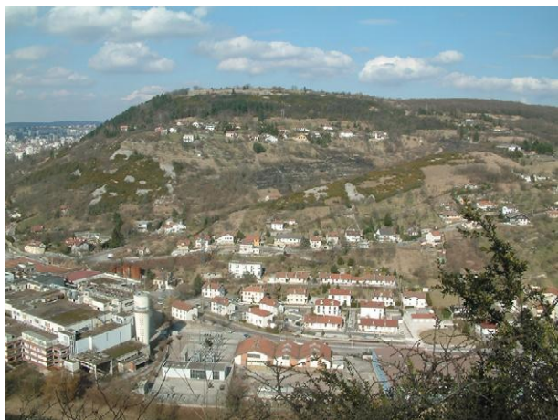
Biotope péri-urbain favorable au grand gibier.

La Fédération des chasseurs du Doubs a réalisé plusieurs types d'actions destinées à diminuer l'impact de l'artificialisation sur les milieux et la faune. Elle a notamment :